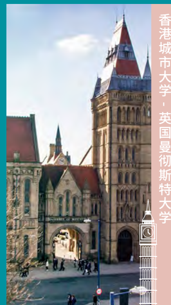
香港城市大学 · 英国曼彻斯特大学

如欲获取更多资料, 请浏览网址 www.cityu.edu.hk/admo/joint-bachelors-degree-programmes-overseas-universities