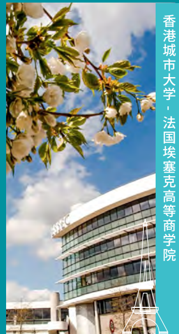
香港城市大学 · 法国埃塞克高等商学院