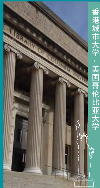
香港城市大学 · 美国哥伦比亚大学

港城大与国际知名大学合办多项双联学士学位课程。为本科生提供国际化的学习机会。学生于四年内在两所大学学习同一专业规定的学士课程后，毕业时将分别获得两所大学所颁发的学士学位。