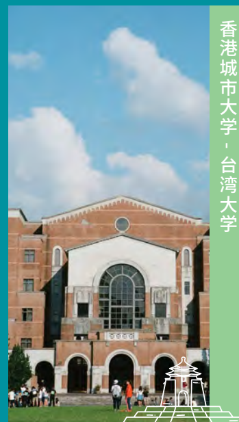
香港城市大学 · 台湾大学