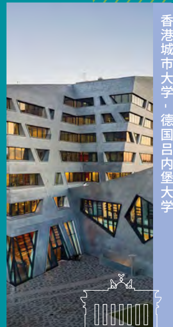
香港城市大学 · 德国吕内堡大学