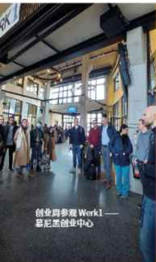
创业周参观 Werk1 —— 慕尼黑创业中心

本课程教授数据分析的基础知识,帮助管理者做出明智决策、识别数据模式,并利用数据洞察推动企业增长。