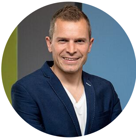
TOBIAS ANGERER 体育管理学士 德国滑雪协会副主席, 营销机构的所有者