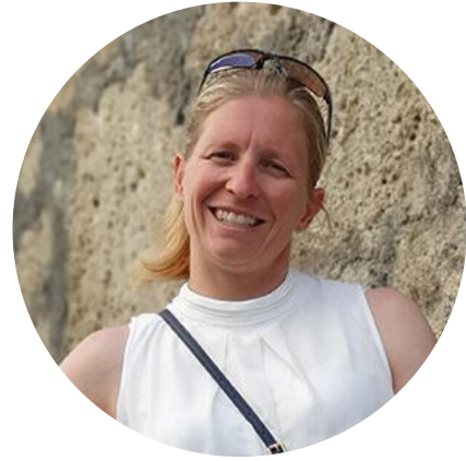
FRANZISKA HILDEBRAND 商业心理学硕士 冬季两项运动员, 运动军人