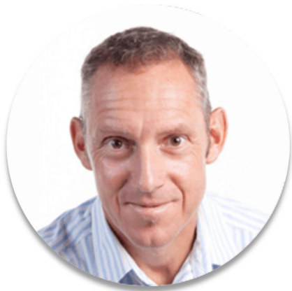
RALF IWAN 德国排球协会的体育总监 奥运会田径决赛选手和奖牌获得者的前教练 卡塔尔著名的 Aspire 体育学院田径部主任