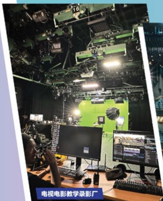
电视电影教学录影厂

香港演艺学院有世界级的表演场地和丰富的教学资源，包括专业设备和设施、及珍贵的表演艺术馆藏，而每年香港演艺学院也提供大量的表演机会，支援学员的学习与实践。