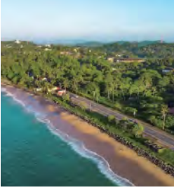
印度洋上的热带岛国 毗邻马尔代夫