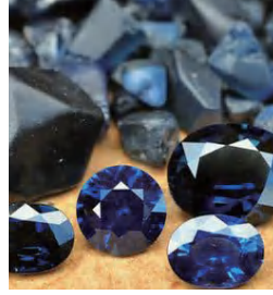
全球著名的 蓝宝石产地