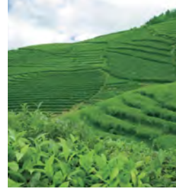
闻名世界的 锡兰红茶