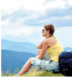
热门的旅游国家 度假圣地