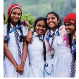
与中国睦邻友好的 “微笑国度”

斯里兰卡，全称斯里兰卡民主社会主义共和国 (THE DEMOCRATIC SOCIALIST REPUBLIC OF SRILANKA)，旧称锡兰，是个热带岛国，位于印度洋海上。