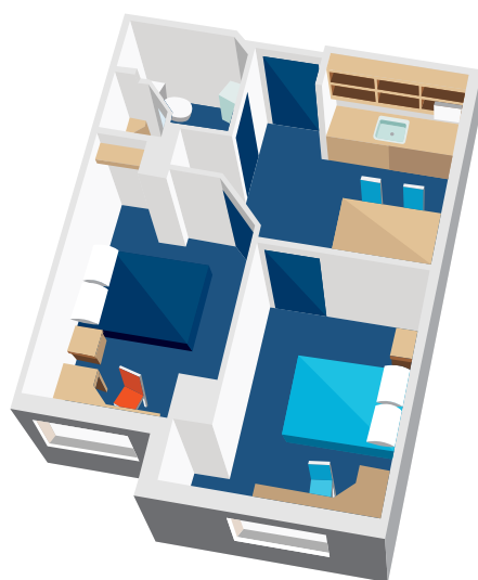
*本图宿舍仅为您在宿舍的居住空间的大致呈现。