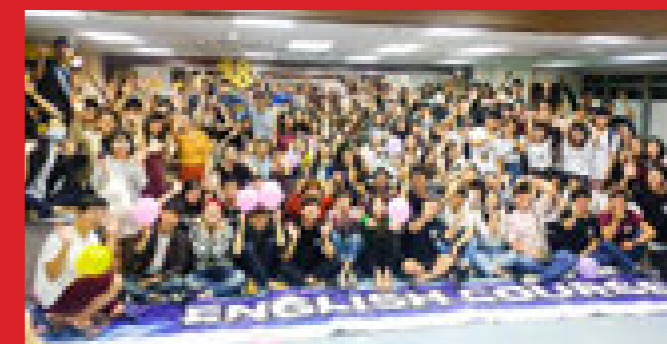
韩国大学生冬季英语课程10所韩国知名大学、共140名韩籍大学生参与由精英大学语言教育学院主办的冬季英语课程，强化英语掌握能力。