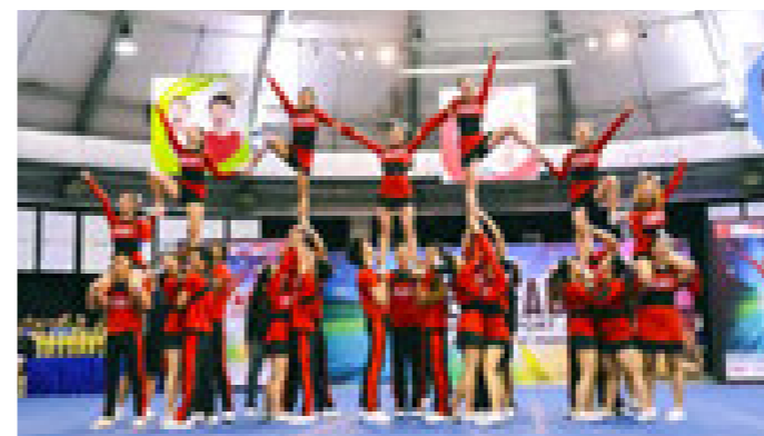
精英大学队伍夺得2017年全国"CHARM 啦啦队"锦标赛。