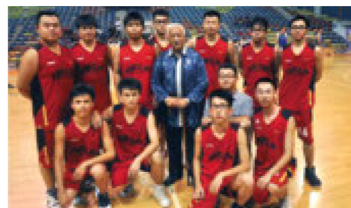
由来自中国的留学生组成的"精英大学篮球队"，多次在篮球比赛中取得优异的成绩。