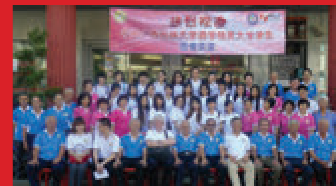
来自中国广西民族大学的学生在精英大学做学术交流和英语培训，也同时感受大马的乡土风情。